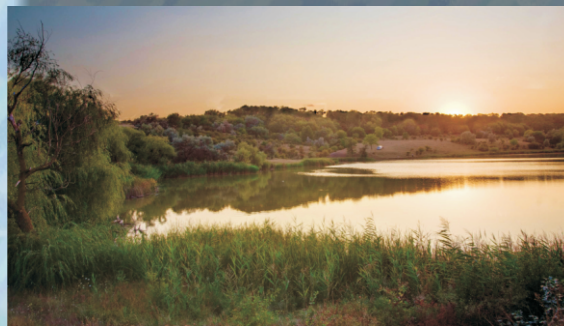
idyllischer See in Tarutino