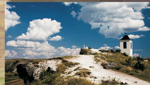
Felsenkloster Orheiu Vechi

5 Tage Ukraine + 5 Tage Moldawien für 1.269 €