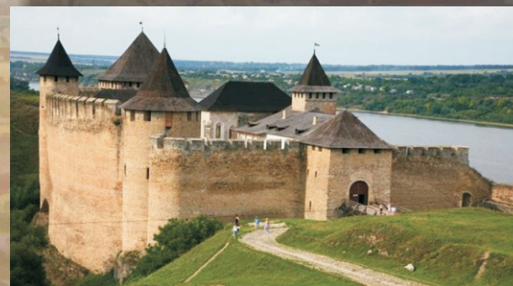
Festung in Bender (Transnistrien)