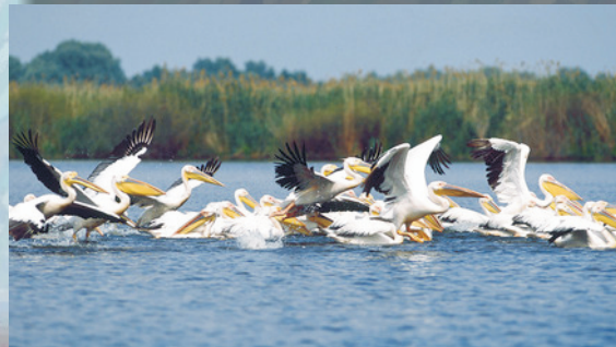
Pelikankolonie in Wilkovo (Donaudelta)