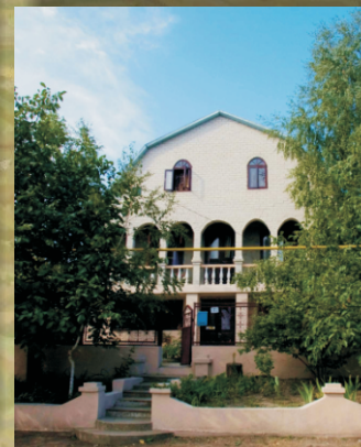
„Bessarabienhaus“ in Tarutino